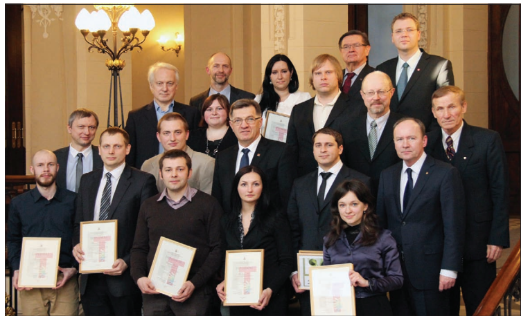
Konferencijos geriausių pranešimų autoriai su Ministru Pirmininku Algirdu Butkevičiumi (centre), konferencijos organizatoriais ir rėmėjais

Konferencijos organizacinis komitetas atrinko geriausių pranešimų autorius, kurių darbus papildomai vertino rėmėjai. Asociacija INFOBALT apdovanojo geriausius fizinių ir technologijų mokslų krypties jaunųjų mokslininkų tiriamuosius darbus ir jų autoriams skyrė vardines bei skatinamąsias stipendijas. Vasario 26 d. iškilmingai buvo įteiktos 4,5 tūkst. Lt vertės keturios vardinės ir trys 500 Lt vertės skatinamo-